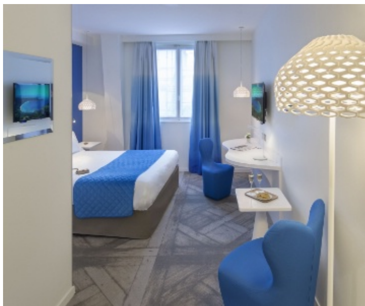
Une chambre bleue.

Entré dans le portefeuille de Paris Inn Group en 2014, l'établissement a achevé sa rénovation en juin, après six mois de travaux et 7 M€ d'investissement. Les travaux ont été réalisés par le cabinet Axel Schoenert Architectes, en collaboration avec Zsofia Varnagy.